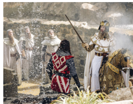
L'Épée du Roi Arthur

Après le petit-déjeuner, route vers votre région via le Bordelais et le Languedoc Roussillon. Déjeuner libre en cours de route. Arrivée dans votre région prévue en début de soirée.