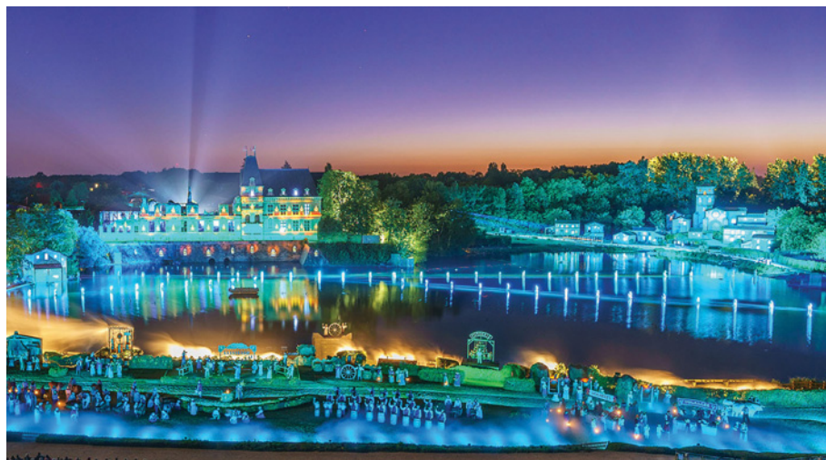
La Cinéscénie