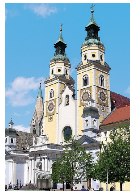
Cathédrale de Bressanone/Brixen

Petit déjeuner et départ vers la France. Déjeuner libre en cours de route. Arrivée prévue dans votre région en fin de journée.